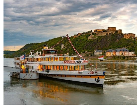
Schiffahrt am Rhein bei Rüdesheim

VORMITTAG: Ausflug ins Moseltal, das zu den schönsten Landschaftsbildern Europas zählt, nach Trier, der ältesten Stadt Deutschlands – Stadtführung in Trier MITTAG: Snack zur Weinverkostung, danach frei verfügbare Zeit in Trier Rückfahrt entlang der Mosel, kurzer Halt bei Bernkastel-Kues Abendessen im Hotel