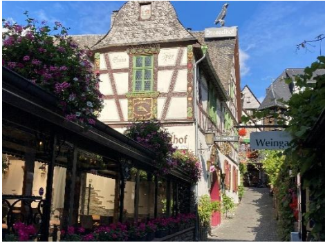
Drosselgasse Rüdesheim