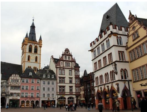
Hauptplatz Trier_Foto: ©reginasphotos/Pixabay

VORMITTAG: Rheinabwärts am rechten Ufer mit Reisleitung durch die Loreley bis Koblenz – Besichtigung der Burg Ehrenbreitstein – Gondelfahrt über den Rhein (Zusammenfluss mit Mosel) nach Koblenz – Stadtbesichtigung MITTAG: Selbstversorgung in Koblenz und Freizeit – Linksrheinisch zurück über Oberwesel, bei Bingen mit der Autofähre nach Rüdesheim. Abendessen im Hotel