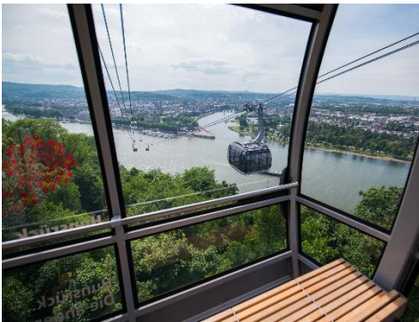
Seilbahn Koblenz_Foto: ©Skyglide Event Deutschland GmbH

Abfahrt in Graz über Suben – Regensburg – Oberölsbach (Mittagessen) – Würzburg – Frankfurt nach Rüdesheim. Rüdesheim liegt eingebettet von Wein­gärten direkt am Rhein und ist bekannt für seine Fachwerkhäuser und malerischen Gassen. Abendessen im Hotel